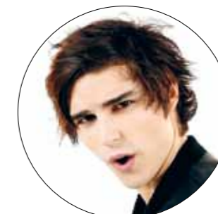
Eric Saade med "Man boy".