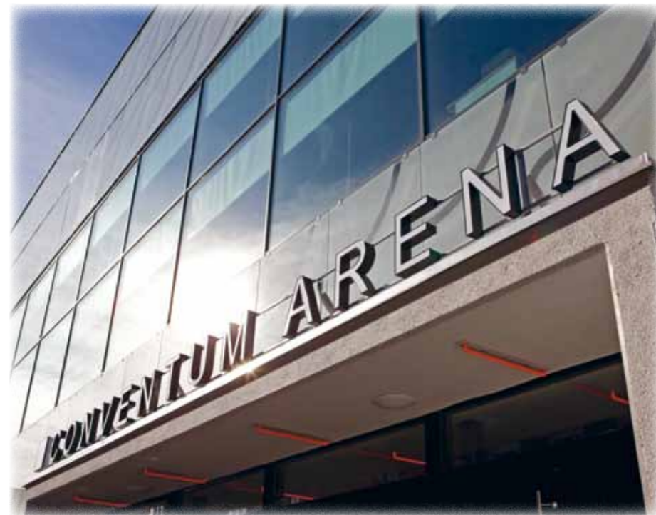
Conventum Arena ska kompletteras med en tillfällig läktare, ett entrétält och personalutrymmen inför Andra Chansen.

– Alla tre föreställningarna sålde slut redan första dagen, men visst kan det hända att en del ströbiljetter kommer tillbaka in i systemet, säger han.