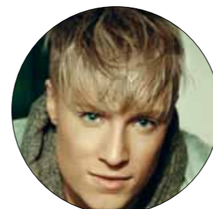
Ola med "Unstoppable".