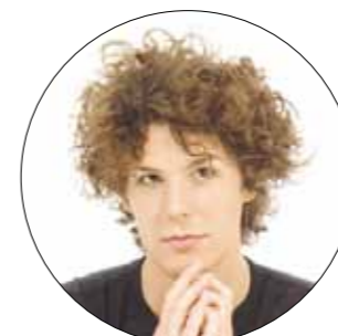
Salem Al Fakir med "Keep on walking".